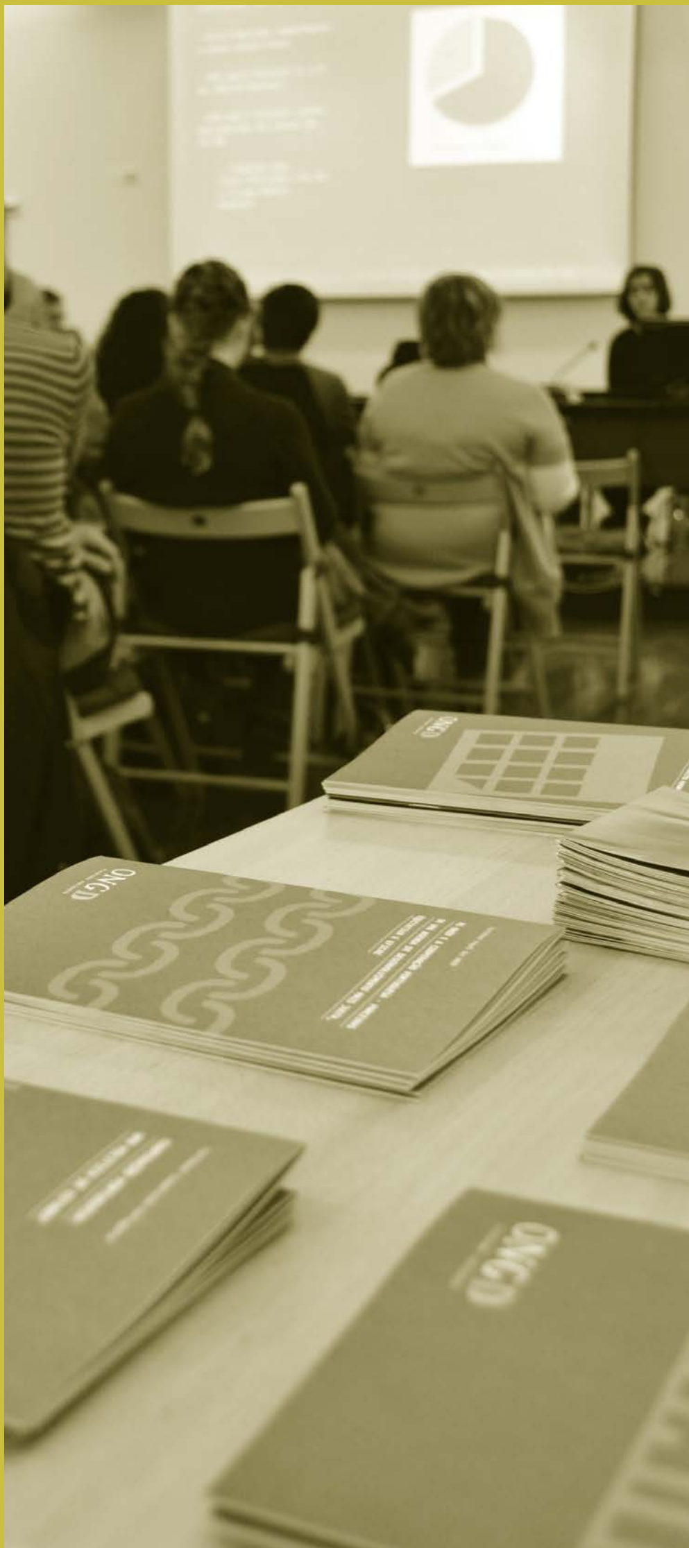
LANÇAMENTO DE FACTSHEETS INFORMATIVAS DA PLATAFORMA PORTUGUESA DAS ONGD SOBRE O ESTADO DA COOPERAÇÃO PORTUGUESA. ACEP. 2013.