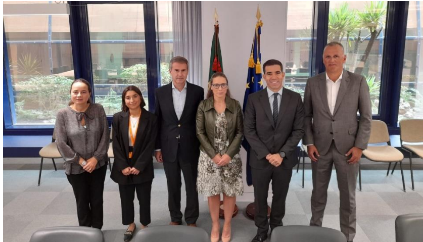
Reunião com o Ministro da Presidência e Secretário de Estado da Presidência do Conselho de Ministros, Lisboa, setembro de 2024