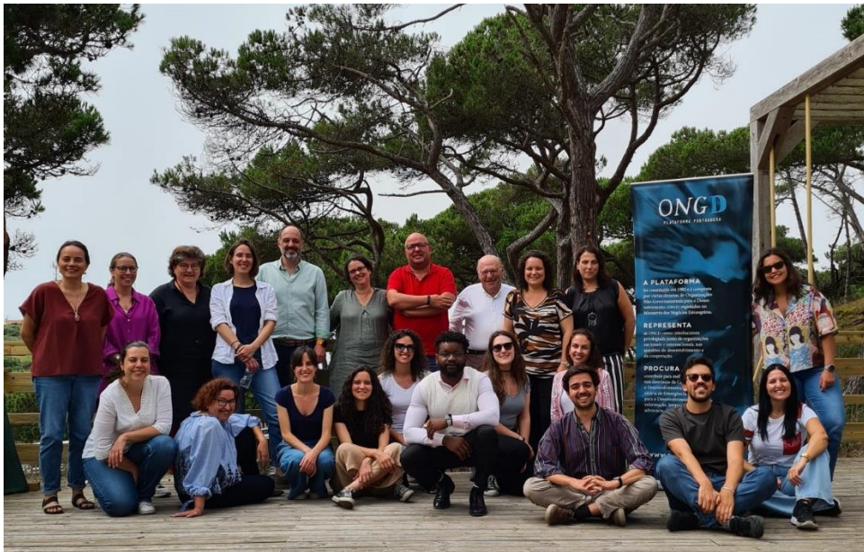
Encontro Anual das Associadas da Plataforma, Sintra 2024