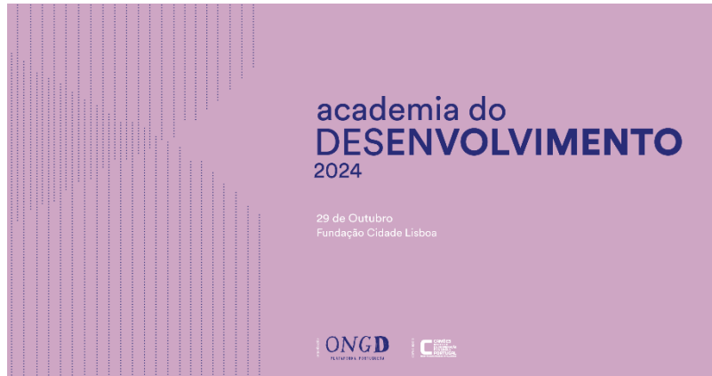
Cartaz da III Edição da Academia do Desenvolvimento, realizado em outubro de 2024