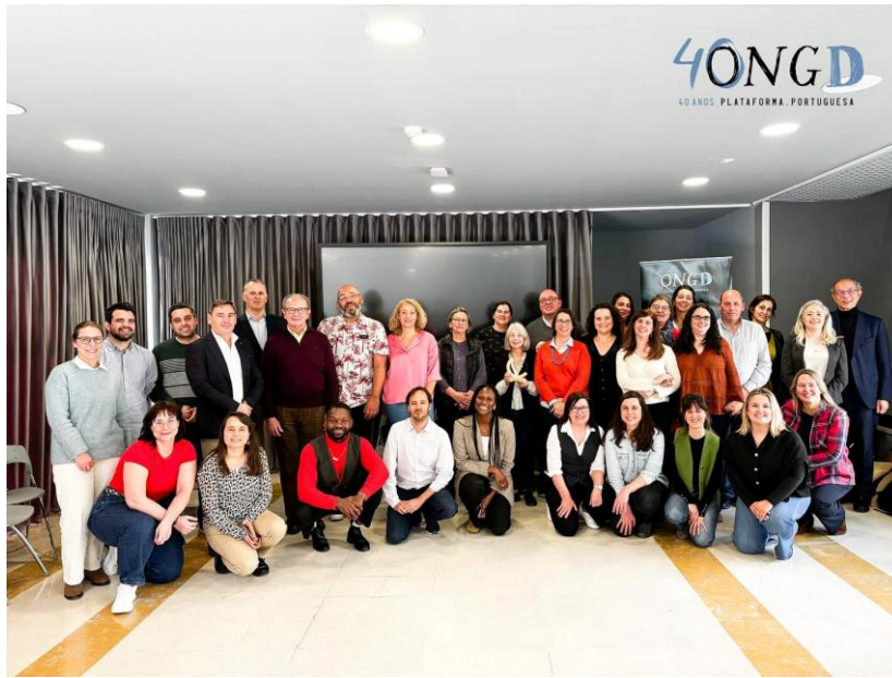
Evento de comemoração interna do 40.º aniversário da Plataforma, março 2025