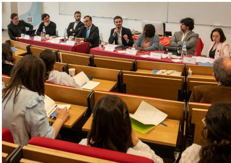
Evento de debate entre candidatos/as às eleições legislativas 2025, abril de 2025