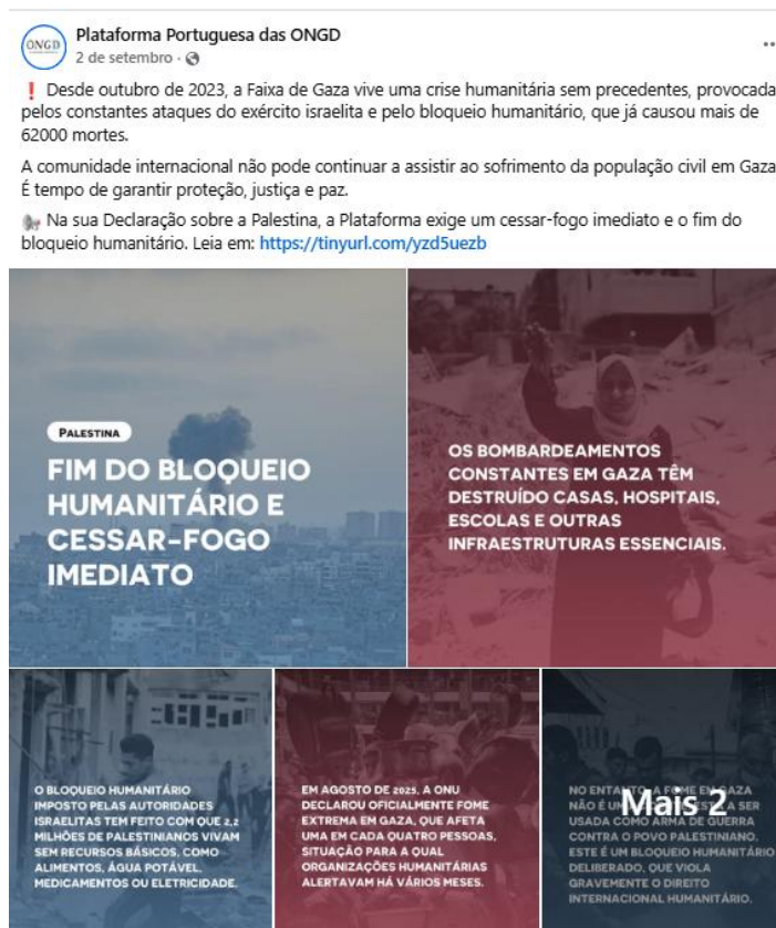
Campanha nas redes sociais pela Palestina, setembro 2025