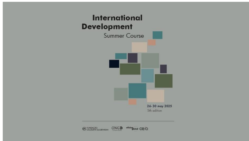
Cartaz do V International Development Summer Course, online maio de 2025